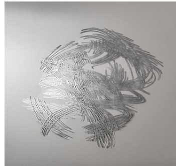
Piece /Phase 2 2023, 130x118 cm Aluminium