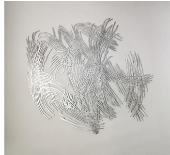
Piece /Phase 1 2023, 130x118 cm Aluminium

Schloss Ebenau 9162 Weizelsdorf 1 office@galerie-walker.at www.galerie-walker.at