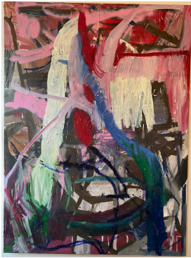
Venedig 2022, 140x190 cm Mischtechnik auf Textil