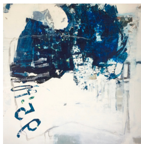
Liegende Neun 2019 120x120 cm Mischtechnik auf Leinen