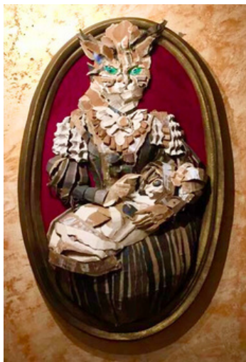
Barockes Kochbuch 2021 190x130x40 cm Kartonrelief

Galerie Miklautz Hintere Gasse 32 9853 Gmünd info@miklautz.at www.miklautz.at