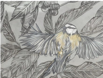
Resistance 3, 2023 (Detail) 160x110 cm, Buntstift/Bleistift auf Transparentpapier