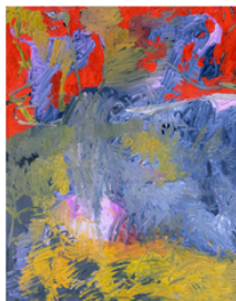
Ohne Titel 2023, 65x85 cm Öl auf Papier