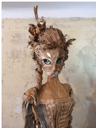
Paradiso Perduto 2023 200x70x100 cm Karton, Leim und Farbe