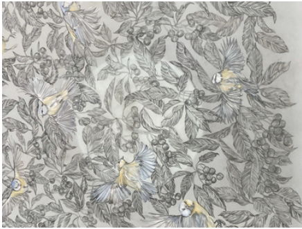
Resistance 1, 2023 (Detail) 160x110 cm, Buntstift/Bleistift auf Transparentpapier