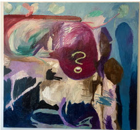
Realtalk 2022, 190x180 cm Mischtechnik auf Textil