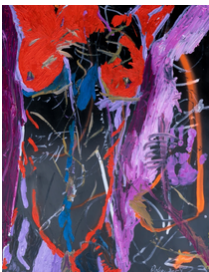
Ohne Titel 2023, 65x85 cm Öl auf Papier