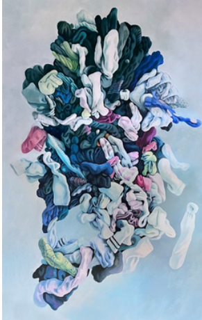
Overthinker - Mensch 7 2023, 400x250 cm Öl auf Leinwand