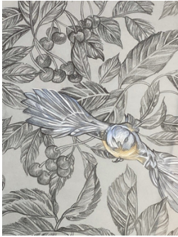
Resistance 2, 2023 (Detail) 160x110 cm, Buntstift/Bleistift auf Transparentpapier