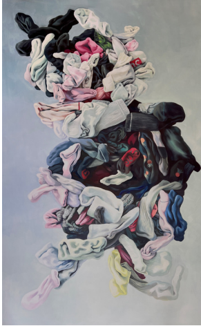
Nonchalance- Mensch 6 2023, 400x250 cm Öl auf Leinwand