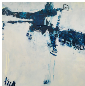
Romeo e Julietta 2019 120x120 cm Mischtechnik auf Leinen